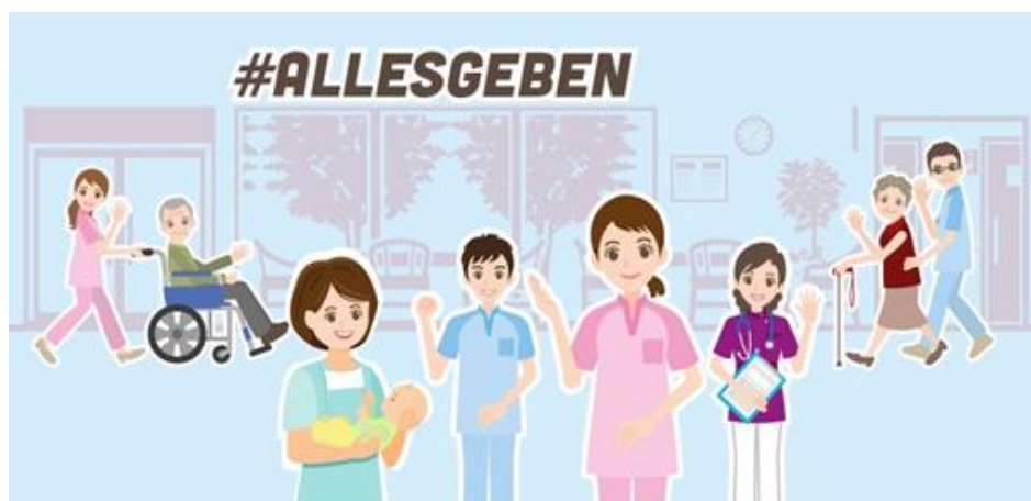
Celebrities und Creator*innen unterstützen mit Livestream-Eventreihe

TikTok wird alle Spenden, die bis zum 27. Mai gesammelt werden, bis zu einer Summe von drei Millionen US Dollar verdoppeln. Der im Rahmen der Kampagne erstmals vorgestellte Spenden-Sticker, mit dem Nutzer*innen im Rahmen von Videos und Live-Streams ganz einfach Spenden für Organisationen sammeln können, soll einen Beitrag im Kampf gegen COVID-19 leisten.